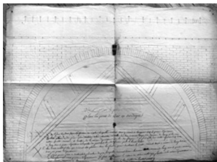
Croquis amb projectes de construcció del pont de Bar, l’any 1816.