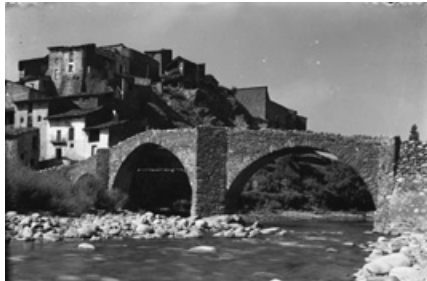
Pont de pedra d'Arfa, el primer terç del segle xx. Arxius Comarcal de l'Alt Urgell, fons Guillem de Plandolit

No obstant això, les dates en les quals trobem citat un pont de pedra en aquest indret són ben tardanes. Els capbreus d'Arfa dels anys 1635, 1665 i 1698 12 fan referència sempre a la palanca , amb aquest nom, i en cap cas s'esmenta cap pont , i el cadastre de l'any 1716 especifica, en parlar del poble, que "té una palanca". 13 El 1789 trobem referències a la Real Academia de Bellas Artes de San Fernando de Madrid sobre els projectes de construcció "de un nuevo puente de piedra en lugar del de madera que ahora tiene dicha villa". 14 Més endavant, el 1804, es diu clarament que el pont "es de madera", 15 el