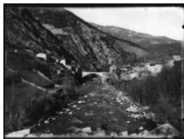
El pont de Bar construït el 1910 i destruït durant la riuada del novembre de 1982.

La Catalunya Romànica ja especifica clarament que "consta que fou volat pels francesos el 1794 i novament pels carlins el 1874. Li quedaven d'època medieval els dos estreps, sobre els murs de carreus romànics dels quals s'havien construït